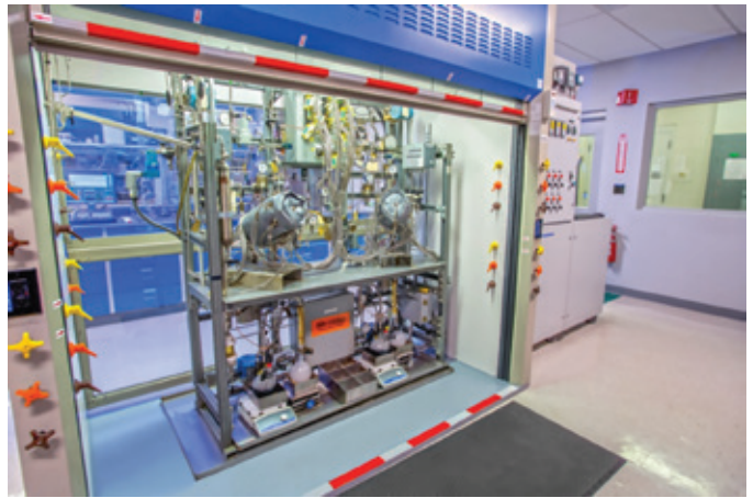
图2. 航空润滑油积碳模拟器 (ALADS) 试验台

这是伊士曼相对于其他滑油制造商, 给行业 and 用户提供高于规范测试要求的试验并带来价值的另一个典型例子。