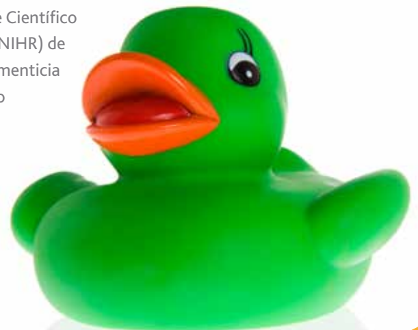
Eastman 168™ plastificante libre de ftalatos